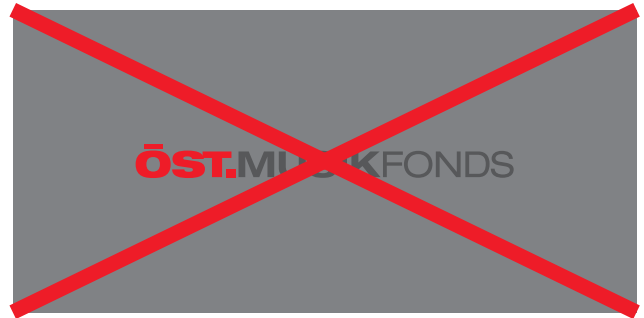
Logo/Marke 4C , RGB, Schmuckfarben