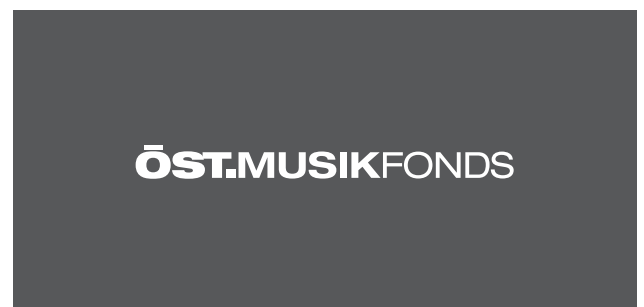
Logo/Marke SW (Strich)